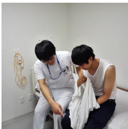
片手で着替えをする練習