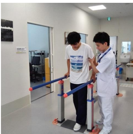
平行棒を使用している歩行練習

毎日365日のリハビリを継続し一人あたり最大で3時間のリハビリテーションをマンツーマンで実施させていただいています。機能回復を促し残された能力を最大限に伸ばすための練習を行います。「できるADL（日常生活動作）」を入院中の生活の場である病棟で「しているADL」につなげ自分のことは自分で行っていただくようサポートしながら早期の家庭復帰や社会復帰を目指します。