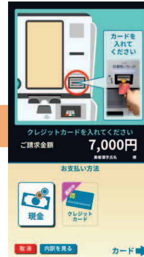
③ クレジットカード挿入