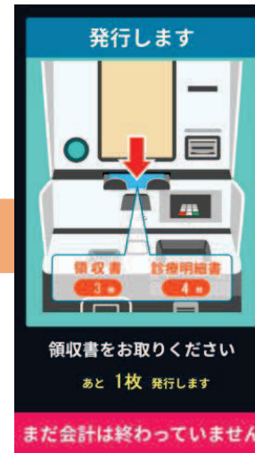
⑦ 領収書・明細書発行