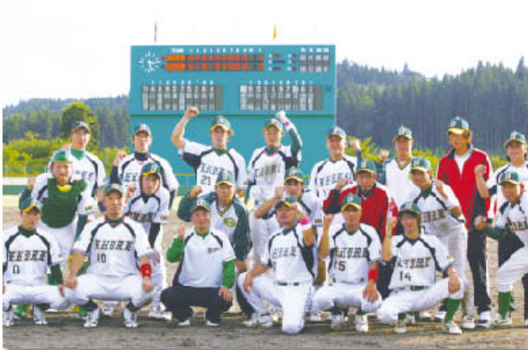
第62回国民体育大会(秋田県)2007.9/30~10/3 軟式野球(一般A)全国6位入賞 秋山工業倶楽部

救急指定病院 地域がん診療連携拠点病院 病院機能評価機構認定病院 医師臨床研修指定病院