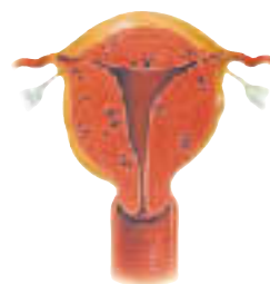
子宮腺筋症（びまん型）

月経困難症イコール子宮内膜症ではありませんので、まずは 器質的な疾患 がないかどうか診断し、それぞれに応じて治療を行っていきたいと思います。気軽に癌検診のついでに診察にきていただけたらと思います。