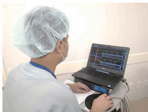
術中神経モニタリング業務