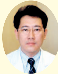
診療部長・がん診療部長